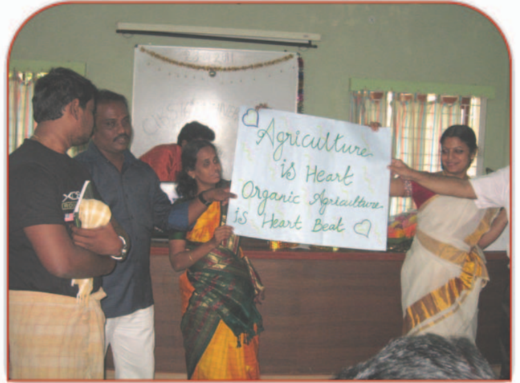
இயற்கைவழி வேளாண்மையின் முக்கியத்துவம் குறித்த கலை நிகழ்ச்சியில் பங்கு பெற்ற பணியாளர்கள்