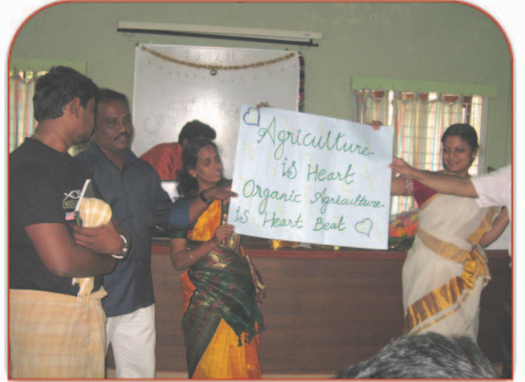
இயற்கைவழி வேளாண்மையின் முக்கியத்துவம் குறித்த கலை நிகழ்ச்சியில் பங்கு பெற்ற பணியாளர்கள்