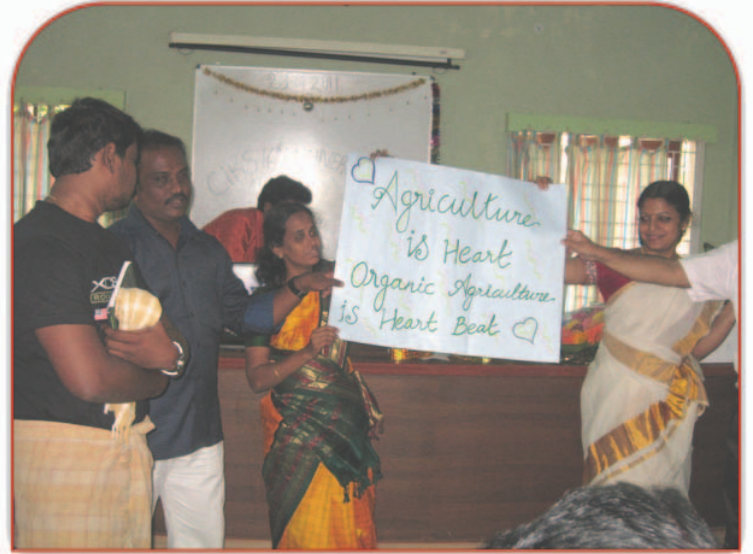
இயற்கைவழி வேளாண்மையின் முக்கியத்துவம் குறித்த கலை நிகழ்ச்சியில் பங்கு பெற்ற பணியாளர்கள்