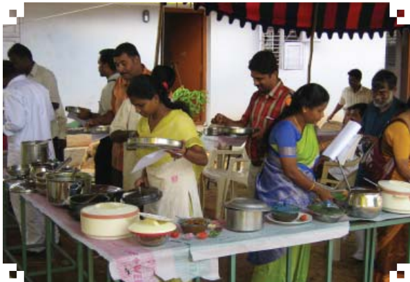
சமையல் போட்டியின் முடிவுகளைத் தீர்மானிக்கும் ஊழியர்கள்