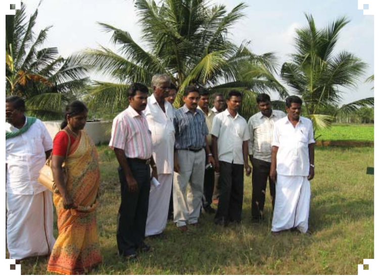
சுக்கன்கொல்லைப் பண்ணையில் கூட்டத்தில் பங்கேற்றவர்கள்